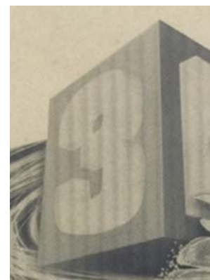
传统印版: 排骨纹非常明显