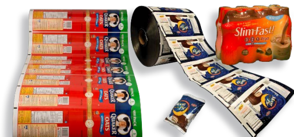
Plate Technology Time: Les plaques gravables à l'eau AWP™ sont plus efficaces que les plaques au solvant lors d'un changement de job.